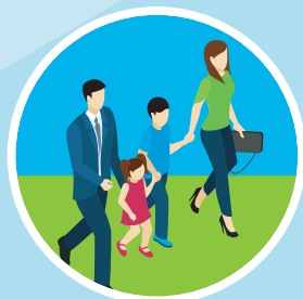
Le point de vue des parents