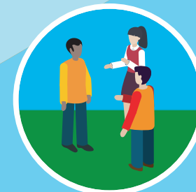
Le point de vue des élèves