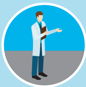
Le point de vue de la recherche